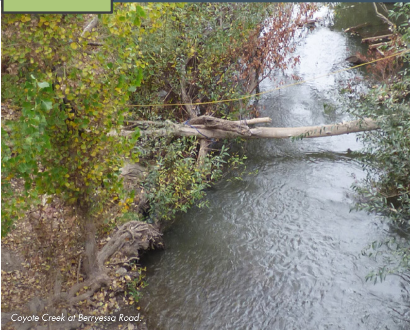
Coyote Creek at Berryessa Road.

PRIORITY E Provide flood protection to homes, businesses, schools, streets and highways.